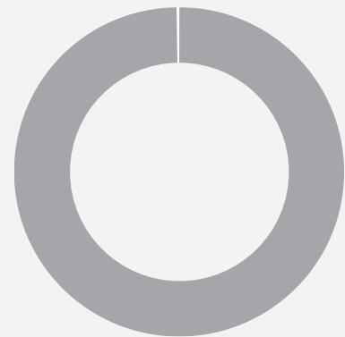
2. Taxonomie-Konformität der Investitionen ohne Staatsanleihen

■ Taxonomiekonform ■ Andere Investitionen